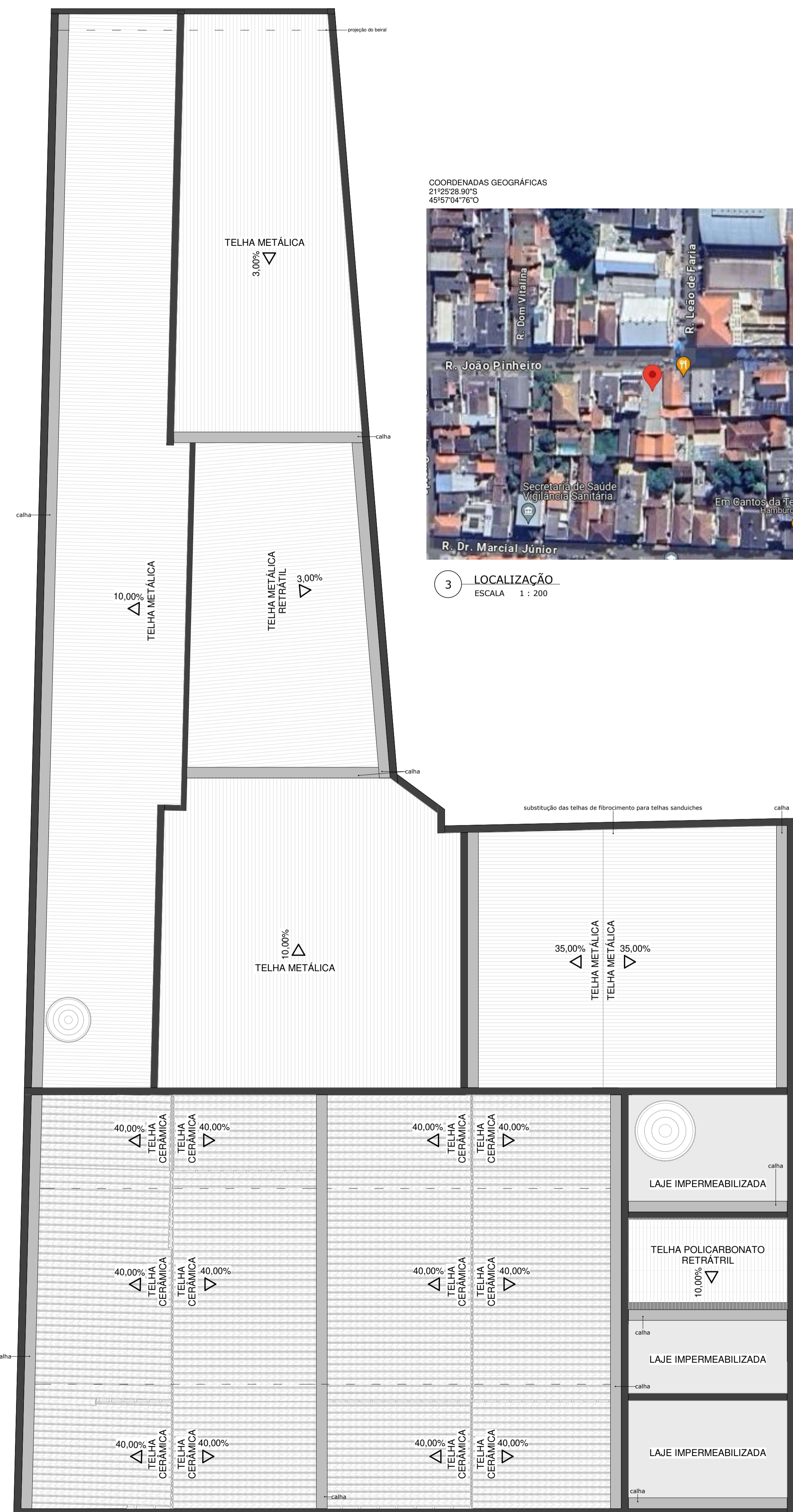
2 PLANTA DE COBERTURA - LEVANTAMENTO CADASTRAL ESCALA 1 : 75

COORDENADAS GEOGRÁFICAS 21°25'28.90"S 45°57'04.76"O