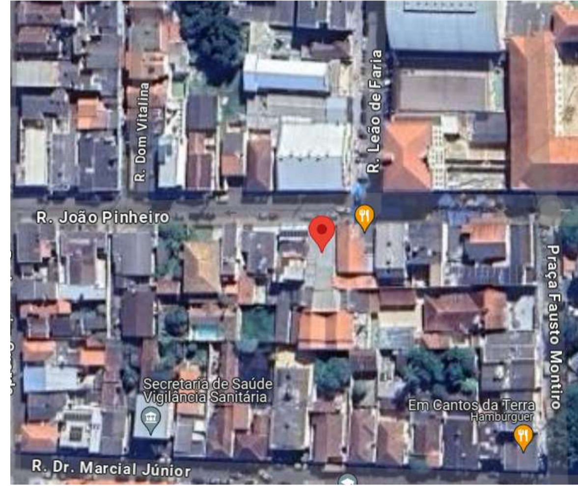
3 LOCALIZAÇÃO ESCALA 1 : 200

COORDENADAS GEOGRÁFICAS 21°25'28.90"S 45°57'04.76"O